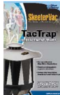
Utbytesfällor CPSX000021 2 st