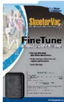
Utbyteslockbeten CPSX000014 1 st